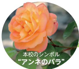
本校のシンボル “アンネのバラ”

オープンスクールでは理科に参加しました。大気圧の授業だったのですが、マシュマロやお菓子の袋を容器に入れ、空気を抜いたり、入れたりして中に入っているお菓子の変化を観察しました。ほとんどの子が初対面で緊張しましたが、とてもいい経験になりました。