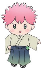
本校の マスコット キャラクター あさひくん

オープンスクールでは理科に参加しました。大気圧の授業だったのですが、マシュマロやお菓子の袋を容器に入れ、空気を抜いたり、入れたりして中に入っているお菓子の変化を観察しました。ほとんどの子が初対面で緊張しましたが、とてもいい経験になりました。