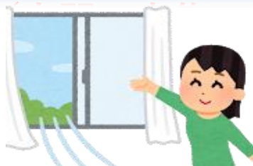
冷房時でもこまめな換気を行う