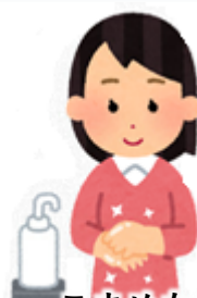
こまめな手洗い・ 手指消毒