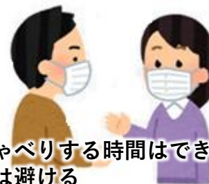
おしゃべりする時間はできる限り短く、 大声は避ける