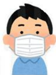
鼻と口を覆い、 すき間なくマスク着用