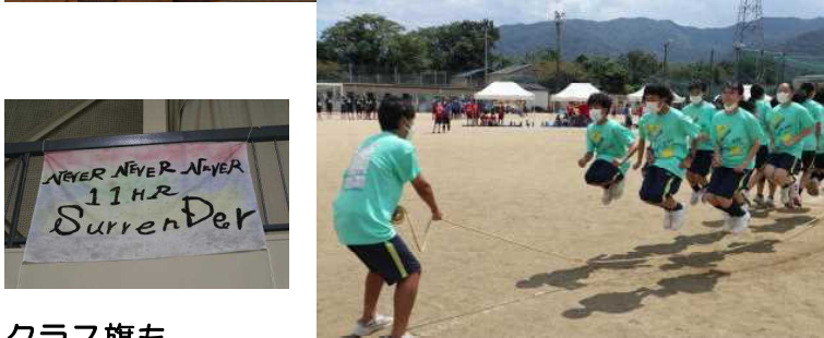
クラス旗も 作りました!