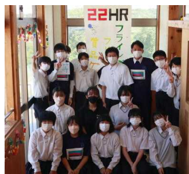
クラス旗も作りました!