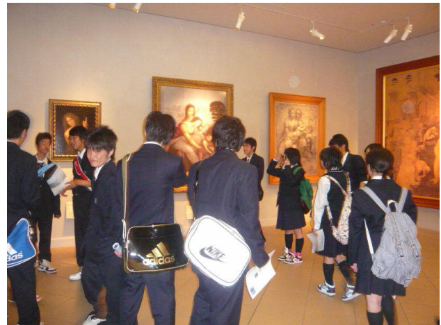
説明を聞いた後、自由に見学しました。