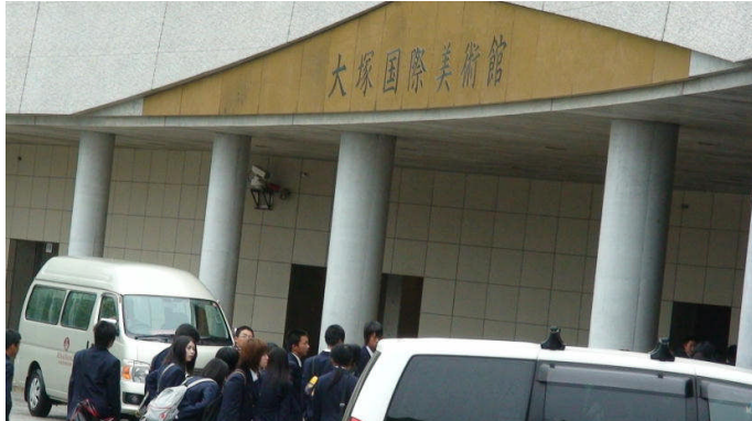
最初に大塚国際美術館を見学しました。