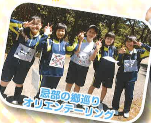
忌部の郷巡り オリエンテーリング