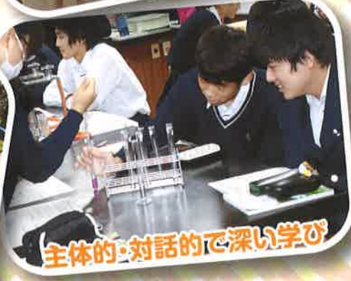
主体的・対話的で深い学び