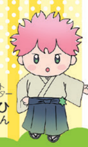
本校の マスコット キャラクター あさひ くん

小学5、6年生の希望者を対象に授業体験を行います！ 一足早く、中学生の気分を味わってみませんか？