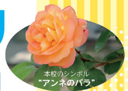
本校のシンボル “アンネのバラ”