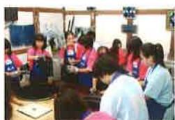
あわ文化体験学習