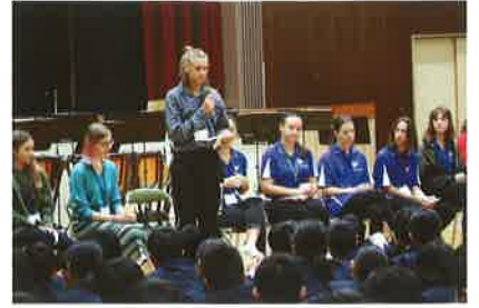
ワルドーフ歓迎式

高校卒業後の進路を見通して、未来の自分を描き、現在の在り方や生き方について考えるキャリア教育に取り組むとともに、様々な教科の体験活動やもの作り活動などを通して、生きる力を育てます。