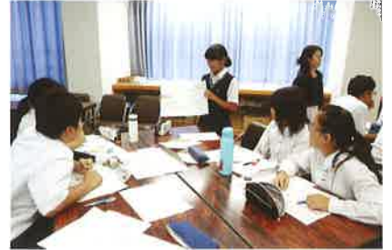
人間関係作りワークショップ