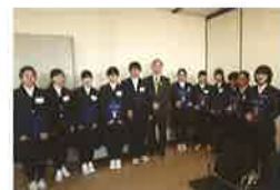
あわっ子文化大使認証式