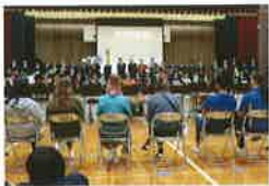
ワールドフ歓迎式