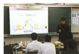
スペシャルアプローチ開講