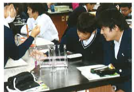
スペシャルアプローチ