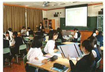
アクティブ・ラーニング