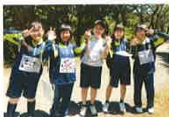
忌部の郷巡りオリエンテーリング