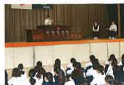
校内人権問題意見発表会